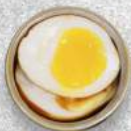
МАРИНОВАННОЕ ЯЙЦО 180 Р.-