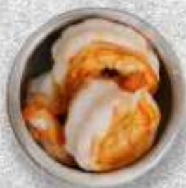
КРЕВЕТКИ ТИГРОВЫЕ 220 Р.-