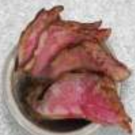
ЗАПЕЧЕНАЯ МРАМОРНАЯ ГОВЯДИНА 220 Р.-