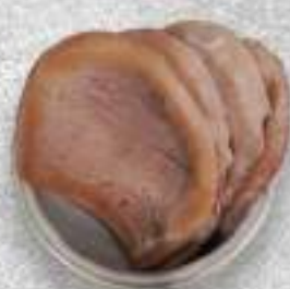
ОТВАРНОЙ ГОВЯЖИЙ ЯЗЫК 220 Р.-