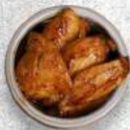
КУРИНАЯ ГРУДКА В СОУСЕ ТЕРИЯКИ 180 Р.-