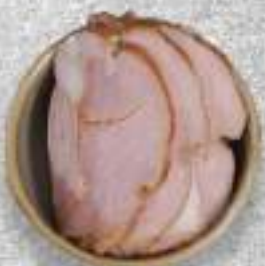
РУЛЕТ ИЗ СВИНОЙ ГРУДИНКИ 220 Р.-