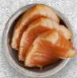
ЛОСОСЬ В МАРИНАДЕ 280 Р.-